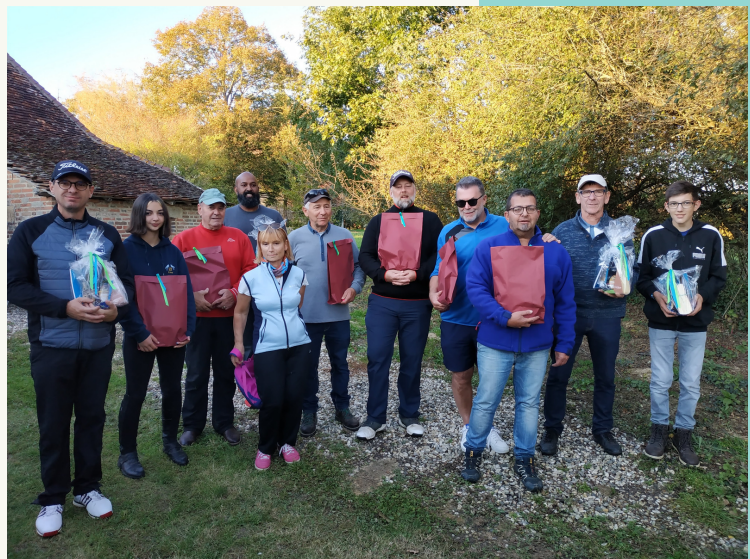
Remise des prix : rencontre amicale du 15 octobre 2021 à Chapelle-Voland.

Le Swin-golf est devenu officiellement un sport depuis le décret ministériel du 8 juillet 1994. La fédération sportive de Swin-golf, « F2S », sous la tutelle de la Fédération Française de Golf, a pour mission d'organiser, d'administrer, de diriger, de contrôler et de développer le sport et l'enseignement du Swin-golf, ainsi que la codification des règles du jeu.